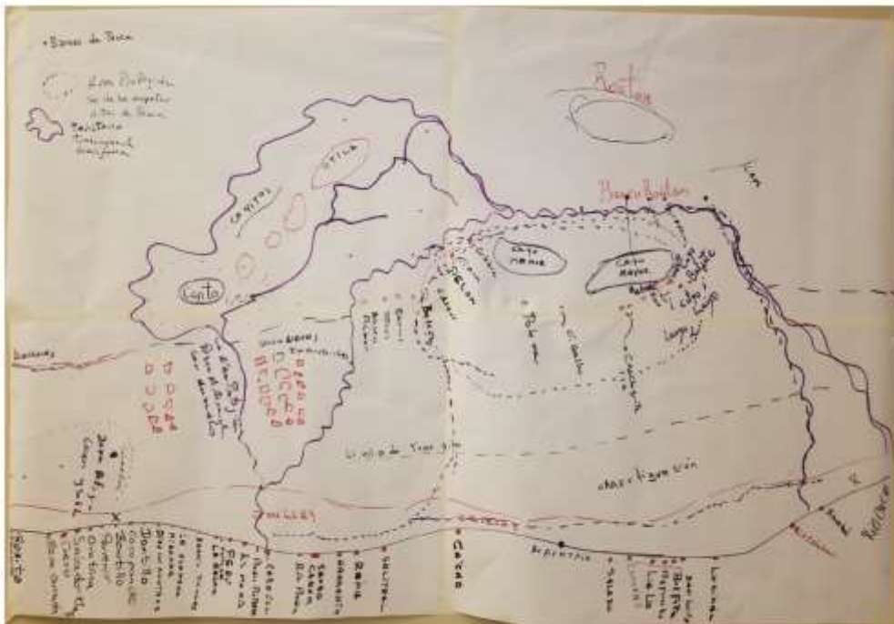
Mapa elaborado durante el desarrollo del taller con el apoyo de los pescadores artesanales.